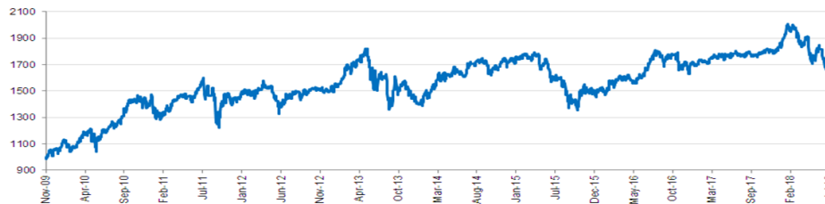
Investra Equity Dynamic Fund